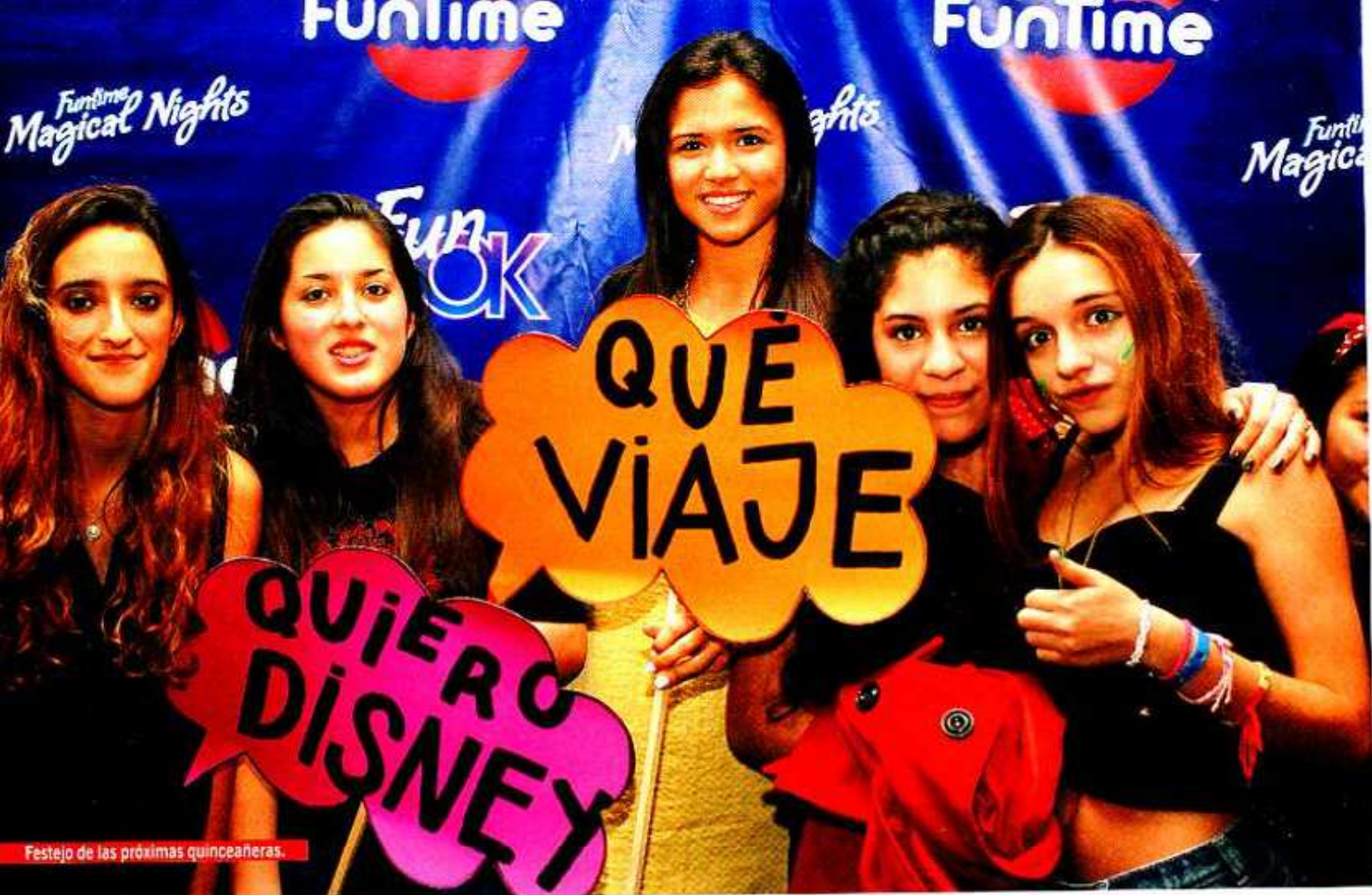
Festejo de las próximas quinceañeras.